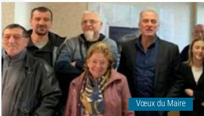
Vœux du Maire