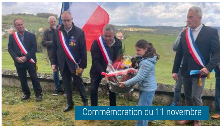
Commémoration du 11 novembre