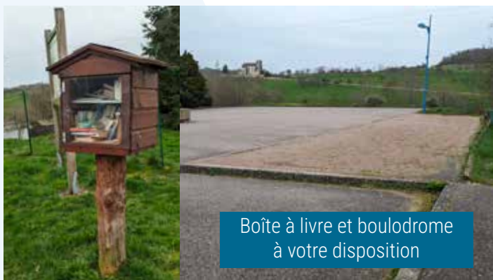
Boîte à livre et bouldrome à votre disposition